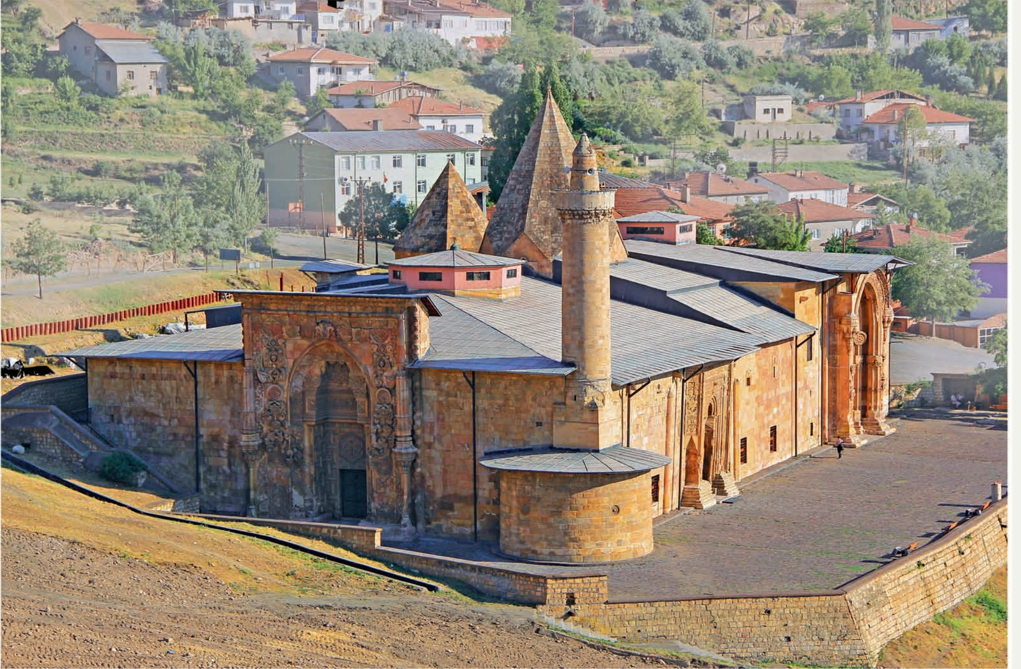
Divriği Ulu Camii ve Dârü'sşifasının (1228) Divriği kalesinden görünüşü.

Mengücekoğulları'nın Divriği kolunun başkentinde 1228 yılında Melike Turan Melek tarafından yaptırılan dârü'sşifa ve ona bitişik olarak eşi Ahmed Şah tarafından bir külliye halinde inşa ettirilen ulucamii. Şifahane yapının güneyinde cami ise kuzeyinde yer almaktadır.