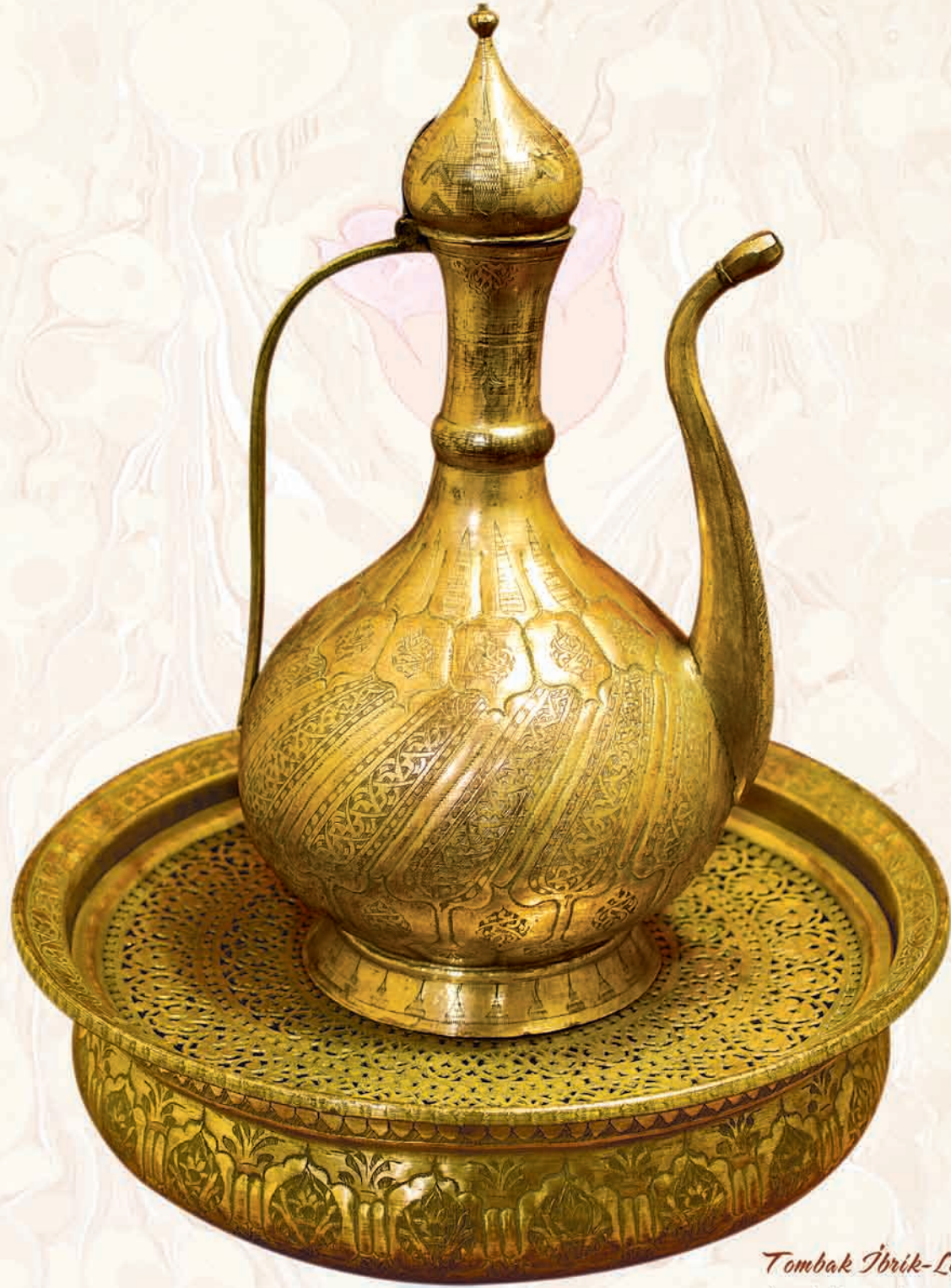
Tombak İbrik-Loğen Osmanlı 19.yy. (Türk İslam Eserleri Müzesi)