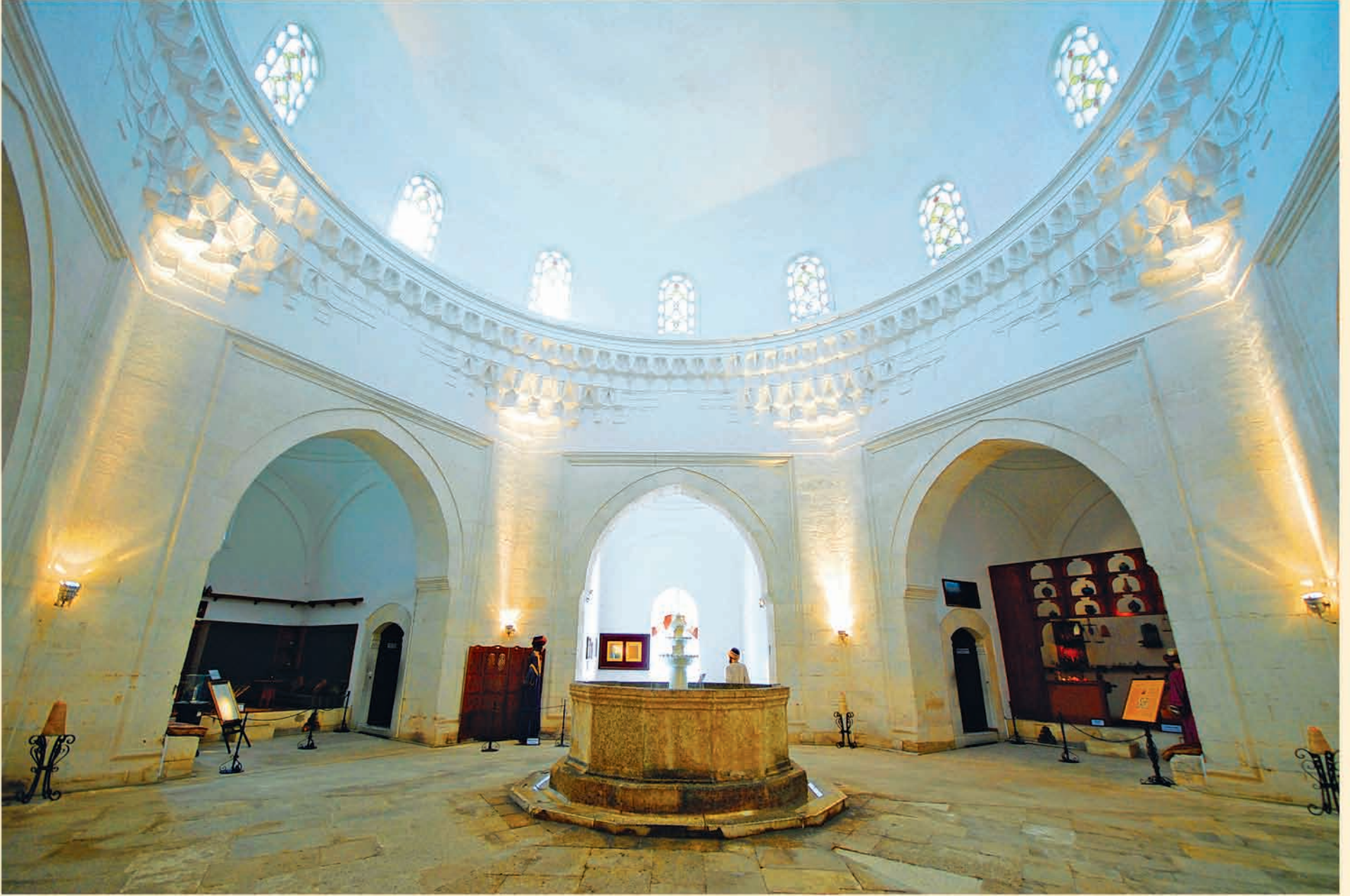
Edirne Sultan II. Bayezid Külliyesi içinde yer alan darüşşifada ortada büyük kubbe ile bunu çevreleyen on iki küçük kubbenin örtüğü altı köşeli ana blok. Bugün sağlık müzesi olarak kullanılan mekanın ortasında fışkıneli havuz bulunmaktadır.

*Anadolu Selçuklu ve Osmanlı çelik abideleri, ŞİFAHANELER* kitabından. Fotoğraf: Abdullah Kılıç