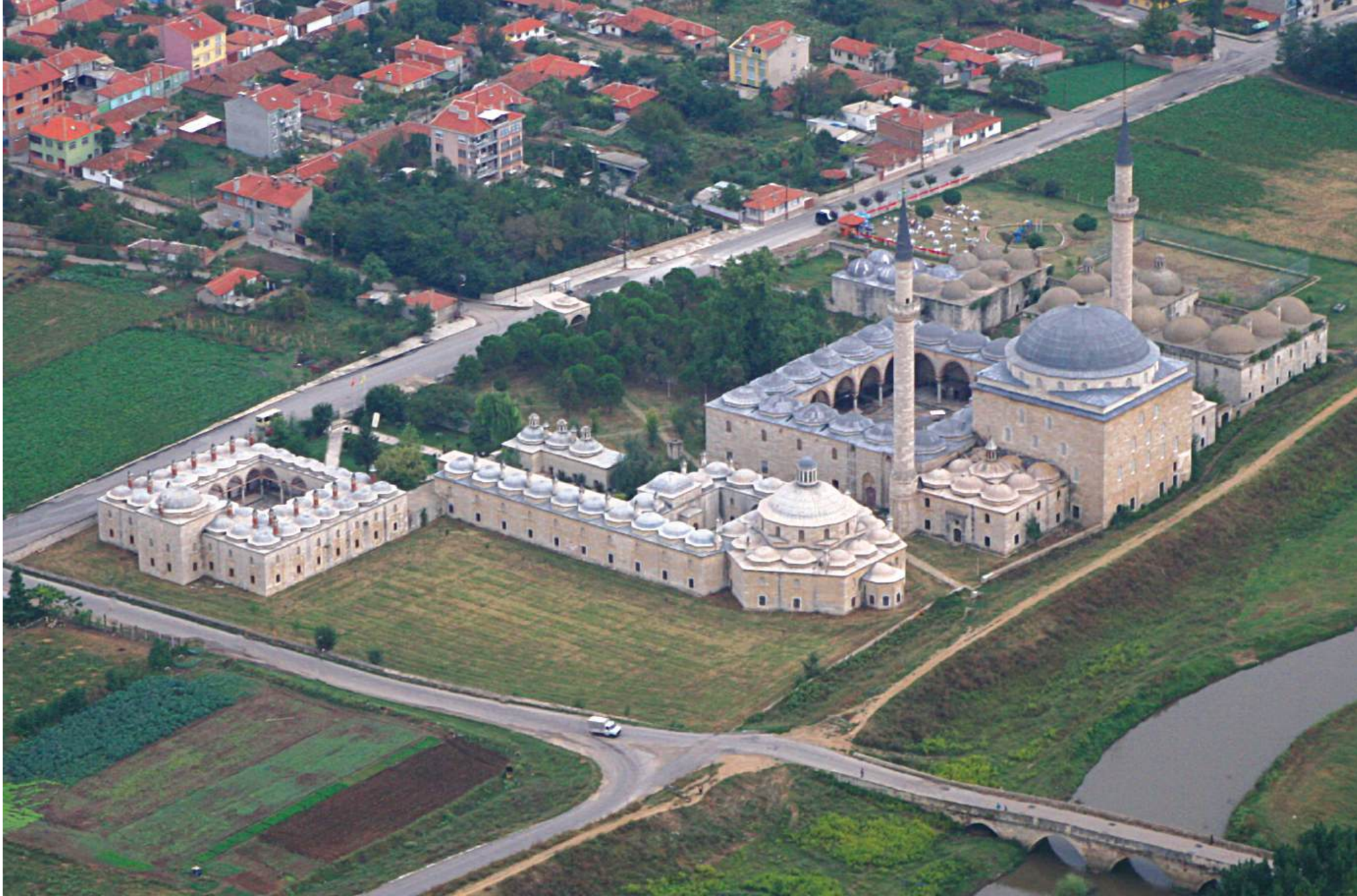
EDİRNE SULTAN II. BAYEZİD KÜLLİYESİ