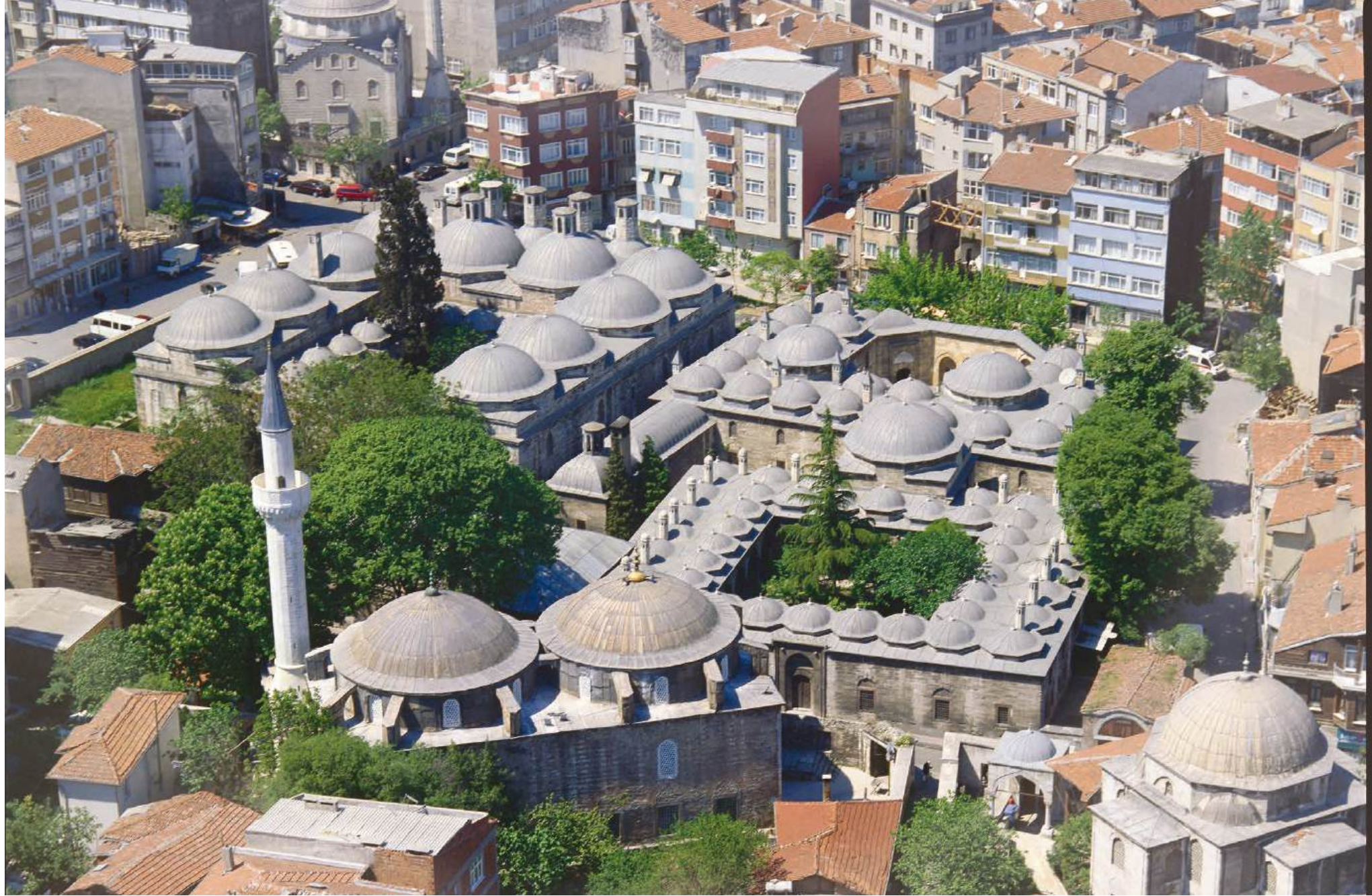
HASEKİ SULTAN K LLİYESİ