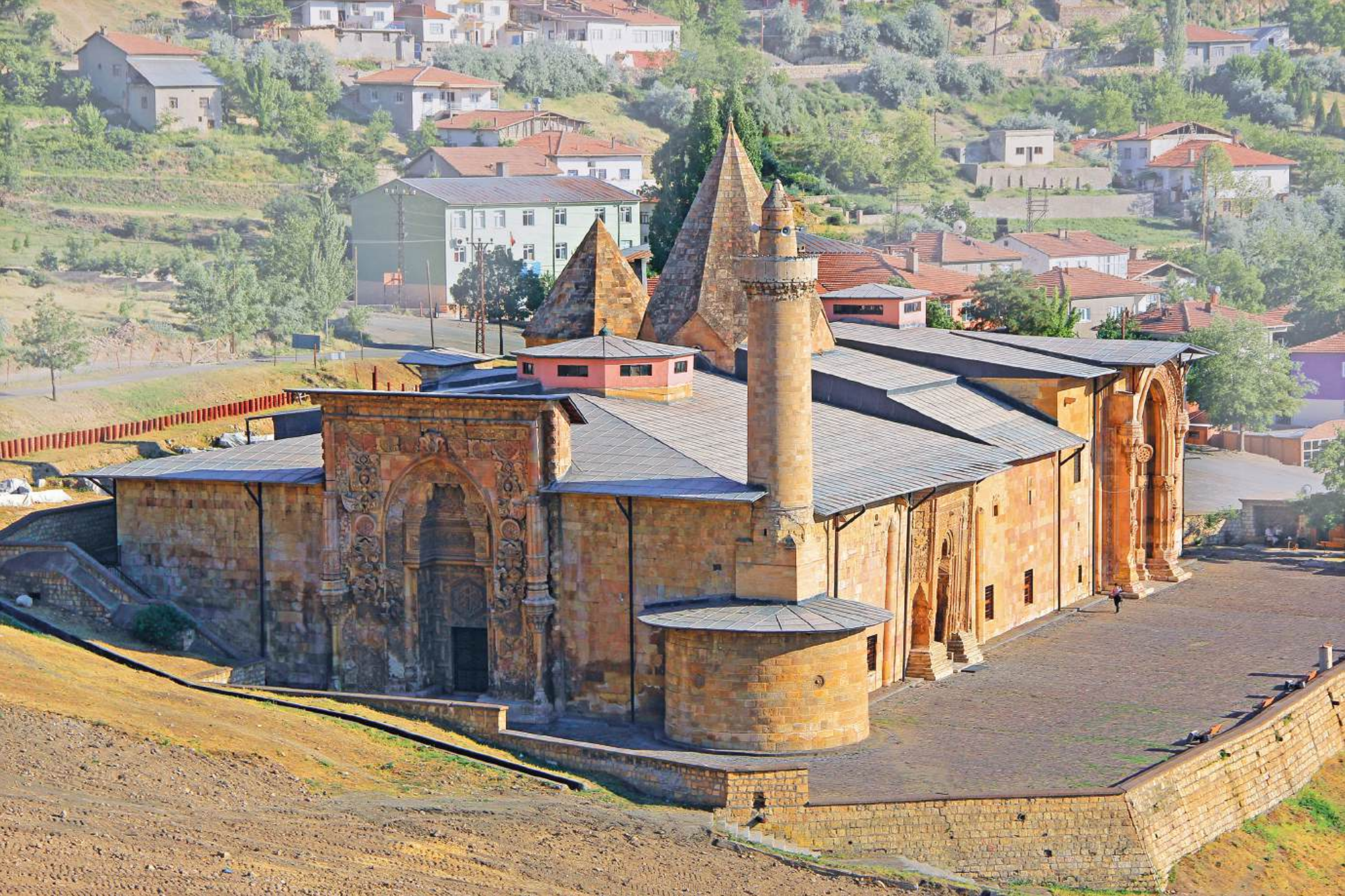
DİVRİĞİ ULU CAMİ VE ŞİFAHANESİ