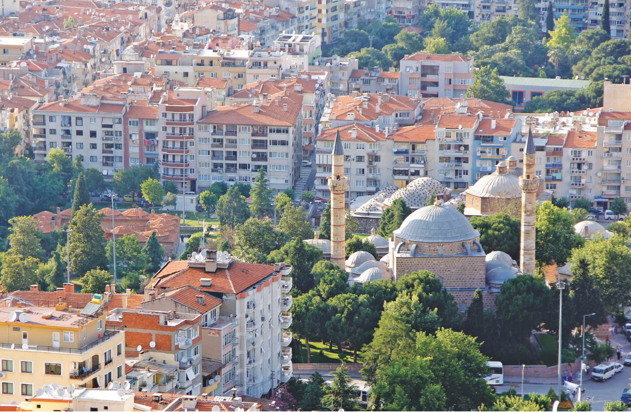
MANİSA HAFSA SULTAN KÜLLİYESİ