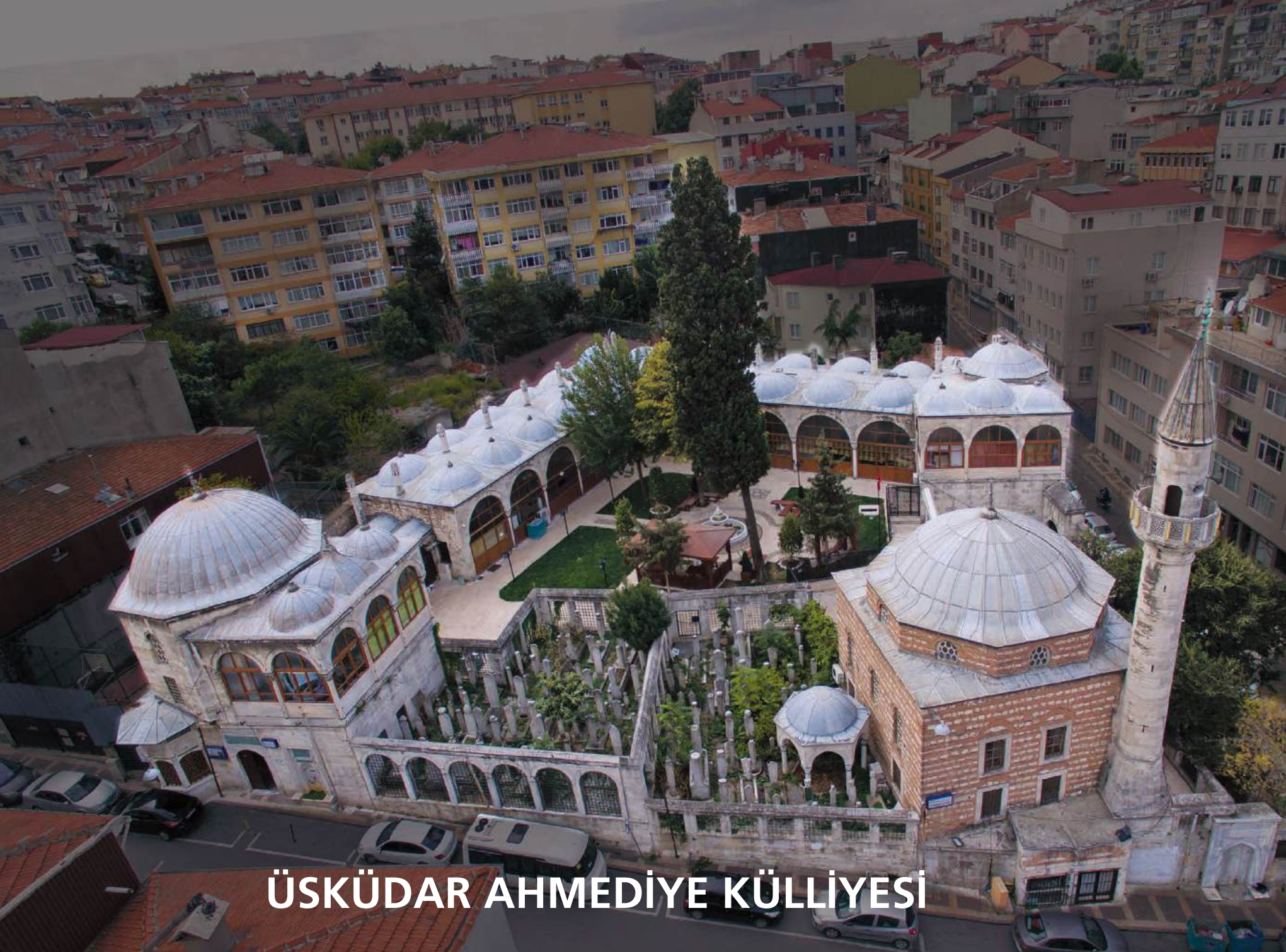
ÜSKÜDAR AHMEDİYE KÜLLİYESİ