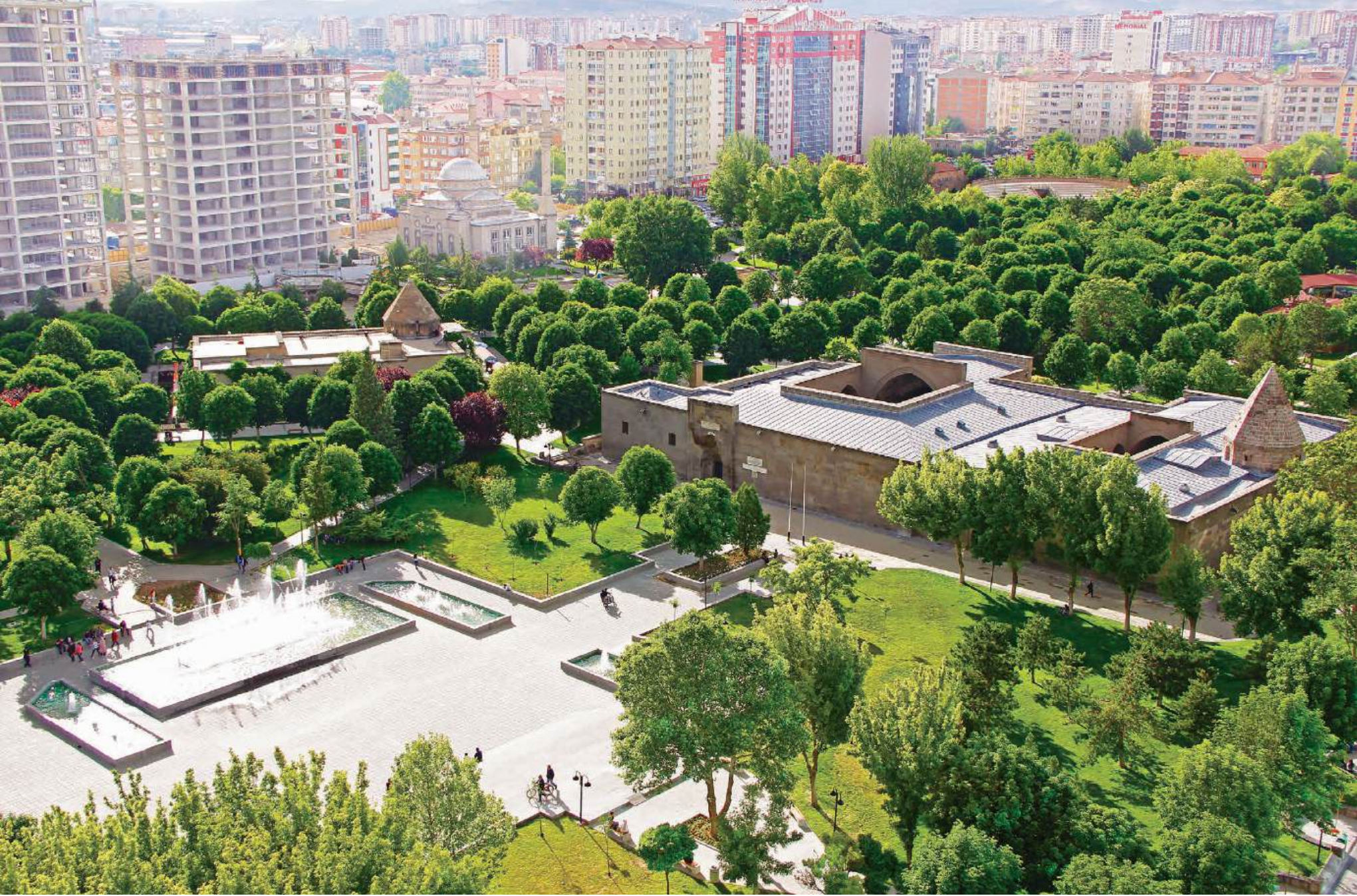
KAYSERİ GEVHER NESİBE ŞİFAHANESİ