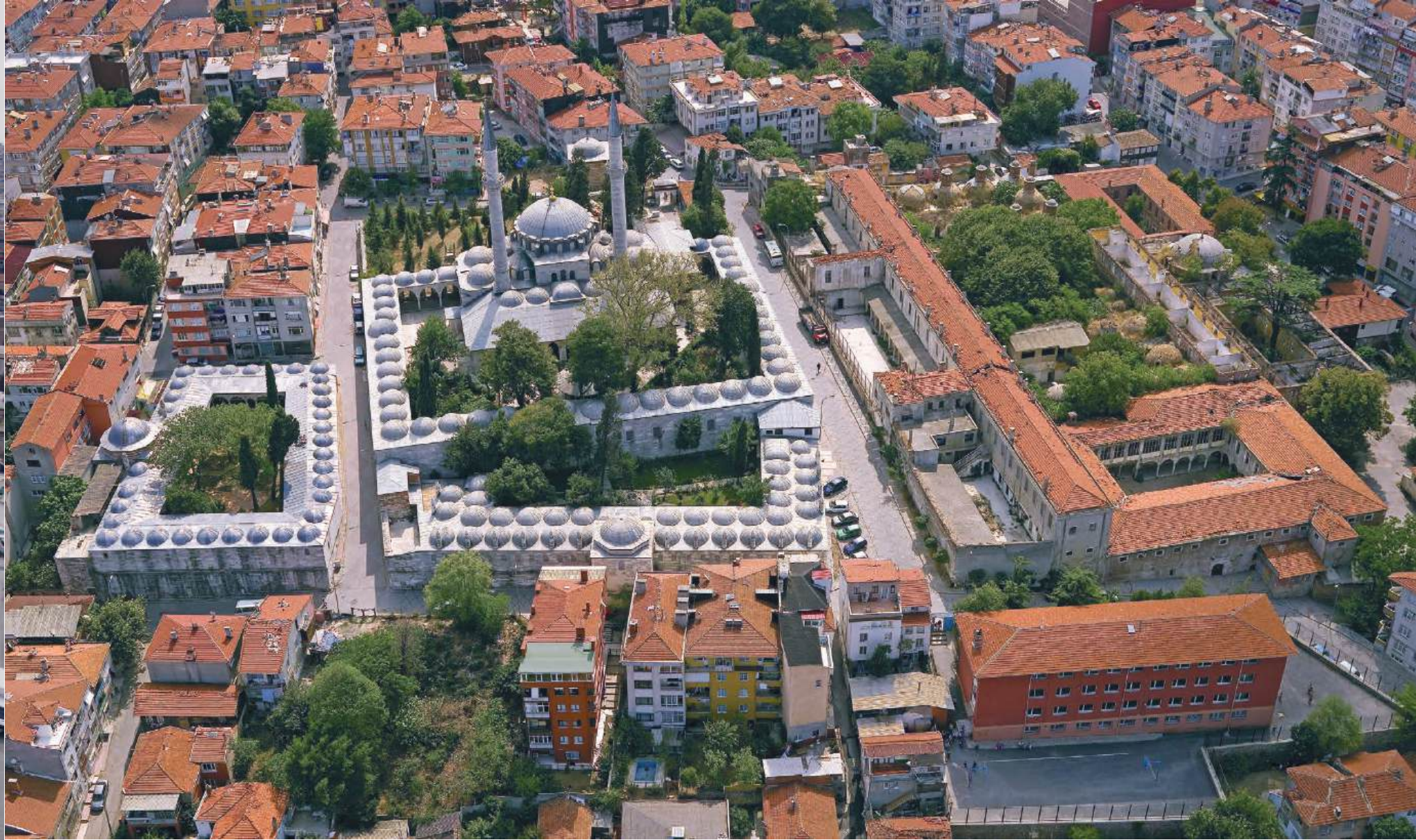
ATIK VALIDE K ULLİYESİ