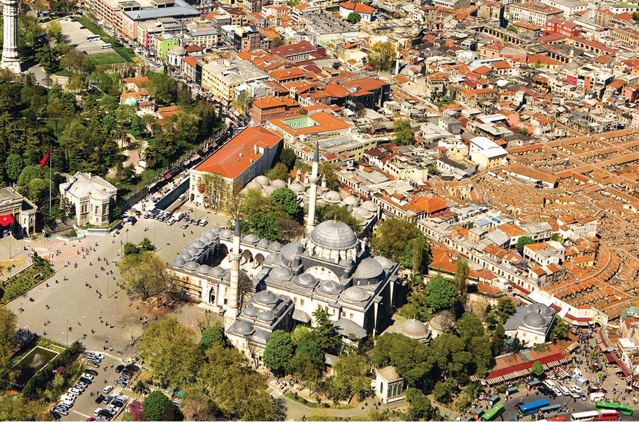
İSTANBUL SULTAN II. BAYEZİD KÜLLİYESİ