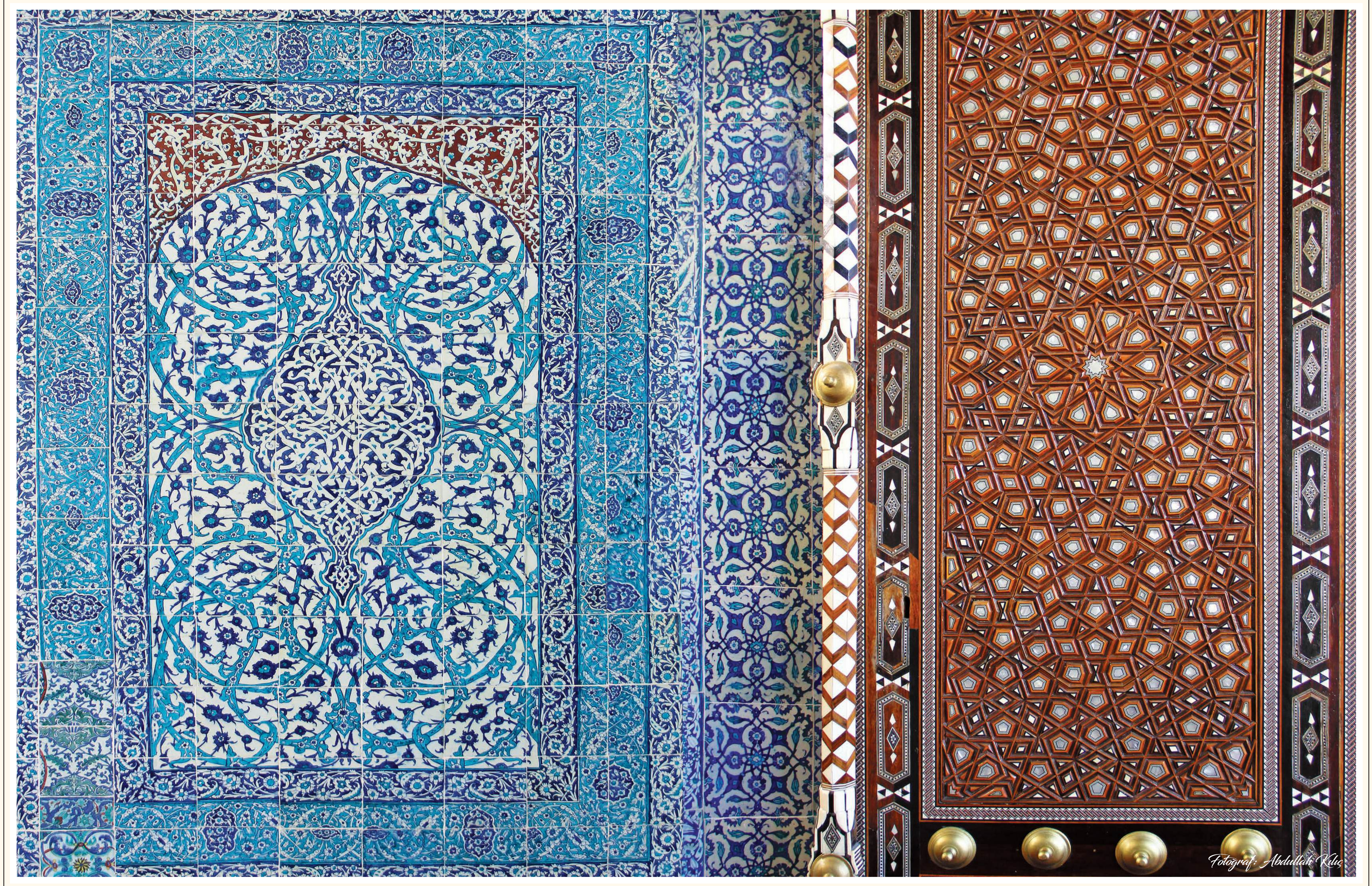
Türbeden bir çini pano ve giriş kapısından detay