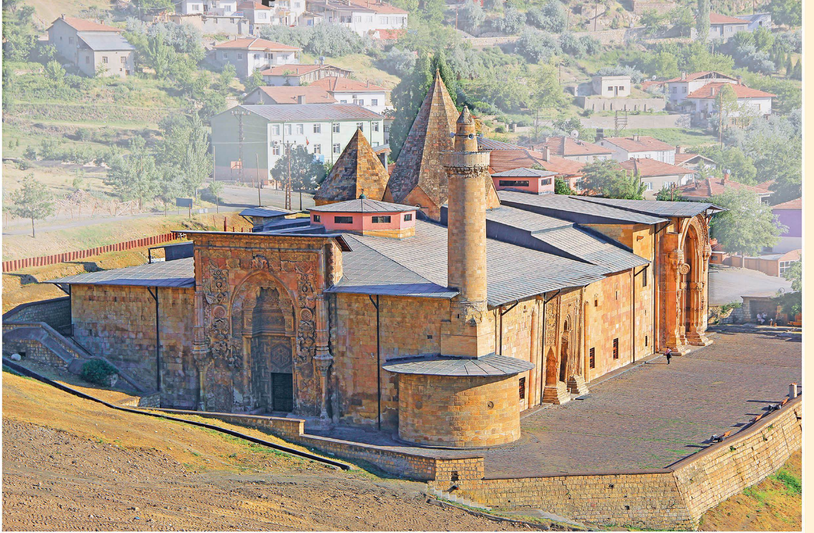
Divriği Ulucamii ve Dârüşşifasının (1228) Divriği kalesinden görünüşü.

Mengücekoğulları'nın Divriği kolunun başkentinde 1228 yılında Melike Turan Melek tarafından yaptırılan dârüşşifa ve ona bitişik olarak eşi Ahmed Şah tarafından bir külliye halinde inşa ettirilen ulucami. Şifahane yapının güneyinde cami ise kuzeyinde yer almaktadır.