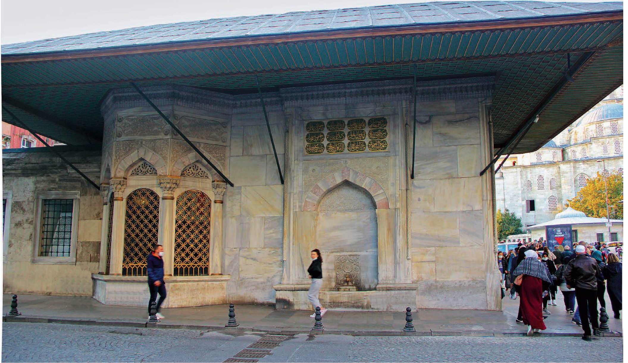
YENİ CAMİ KÜLLİYESİ ÇEŞME VE SEBİLİ