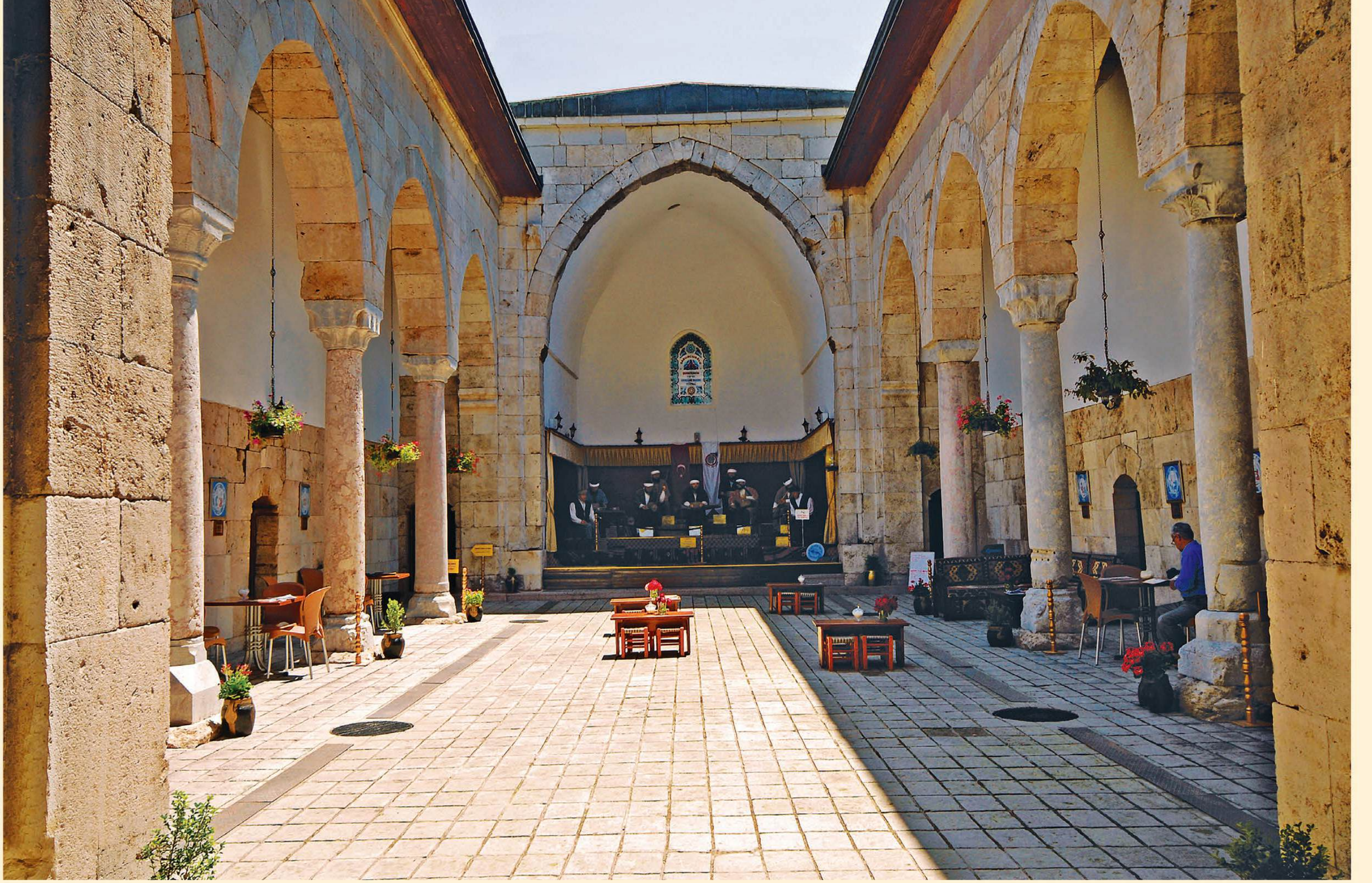
Amasya Dârüşşifası'nın revaklı avlusu ve girişin karşısındaki ana eyvanı. Bugün tıp müzesi olarak kullanılan dârüşşifada ana eyvana musiki heyeti maketleri yerleştirilmiştir.