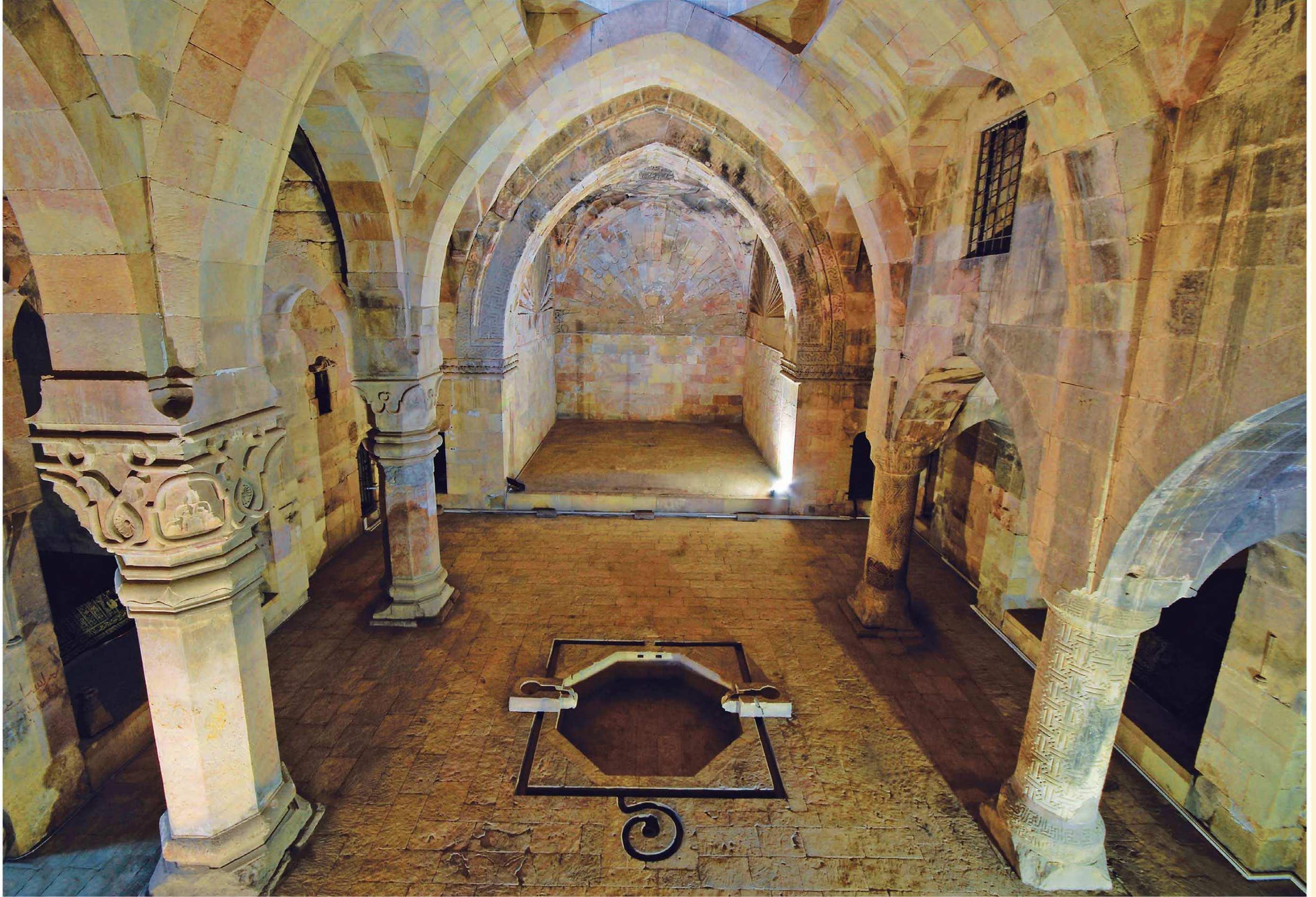
Divriği Turan Melek Dârüşşifasının iç mekanı. Orta avlu, revaklar, ortadaki havuz ve ana eyvan.

Dârüşşifanın taçkapisından, yıldız tonozla örtülü giriş eyvanına oradan da orta mekâna girilir. Orta mekânda simetri esas alınmış olup, üç eyvanın tonozları da giriş tonozu gibi hareketli plastik ifadeye sahiptir. Revaklar, zenginleştirilmiş beşik tonozlarla avluya açılırlar. Orta bölümde yine aynı şekilde tonoz kullanılmış, havuzun üstüne rastlayanın tepesinde açıklık bırakılmıştır. Yapının yan eyvanlarının örtülerinde yıldız tonozun bütün değişik sistemleri uygulanarak hareketli bir görünüş sağlanmıştır. Bu yan eyvanlara sonradan mezarlar ilave edilmiştir. Dârüşşifada iç mekân süslemesi mimari elemanların dekorlanmasıyla oluşur. Ana eyvanın kemer süslemesi üç ayrı bordür halindedir.