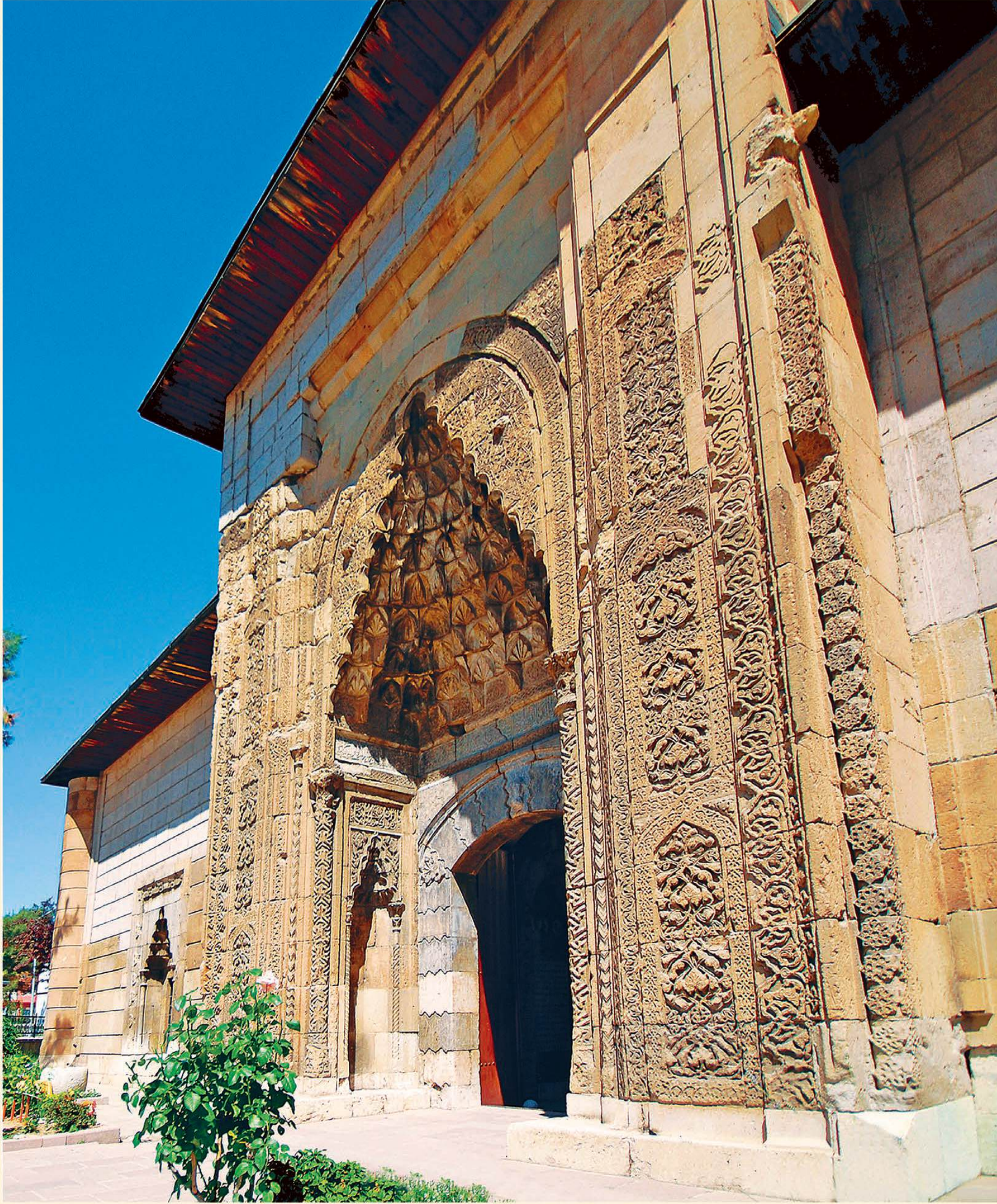
Amasya Dârüşşifası'nın orjinal Selçuklu taş kabartma süslemeleriyle bezeli taçkapsı.

Kapıda bulunan kitâbe arapça olup tercümesi şöyledir: Büyük sultan, en büyük hakan dinin ve dünyanın yardımcısı Sultan Olcaytu Muhammed'in (Allah, onun saltanatını ve büyük halını, büyüklerin kraliçesi İldus Hatun'un şeref günlerini ebedi kılsın ve devletini artırsın) devletinin zamanında bu mübarek dârüşşifayı imar etmekle saltanatının yüceliğini muvaffak kılsın. Zayıl kul Anber bin Abdullah - Allah ondan yaptıklarını kabul etsin yıl 708 (1308).