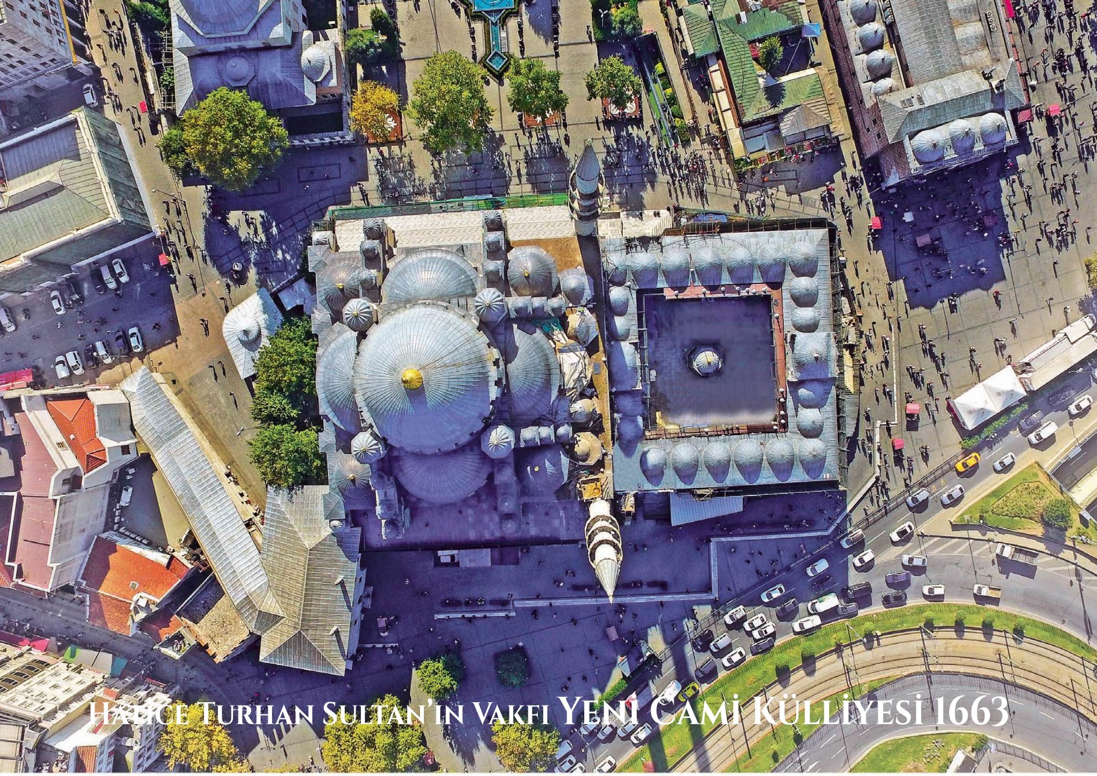
HATİCE TURHAN SULTAN'IN VAKFI YENİ CAMİ KÜLLİYESİ 1663