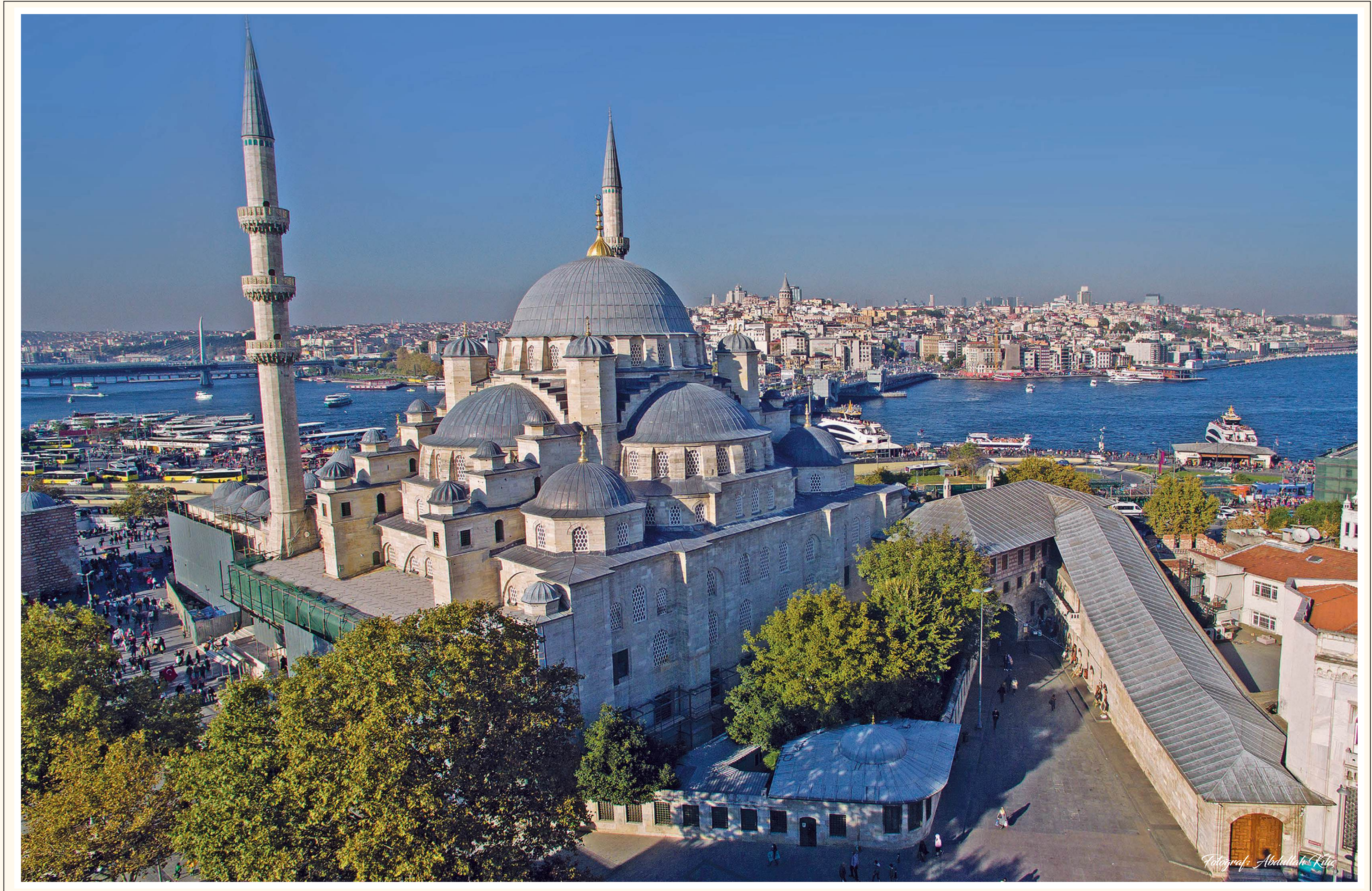
Güney batıdan Yeni Cami, Hünkâr Kasrı ve Muvakkithâne