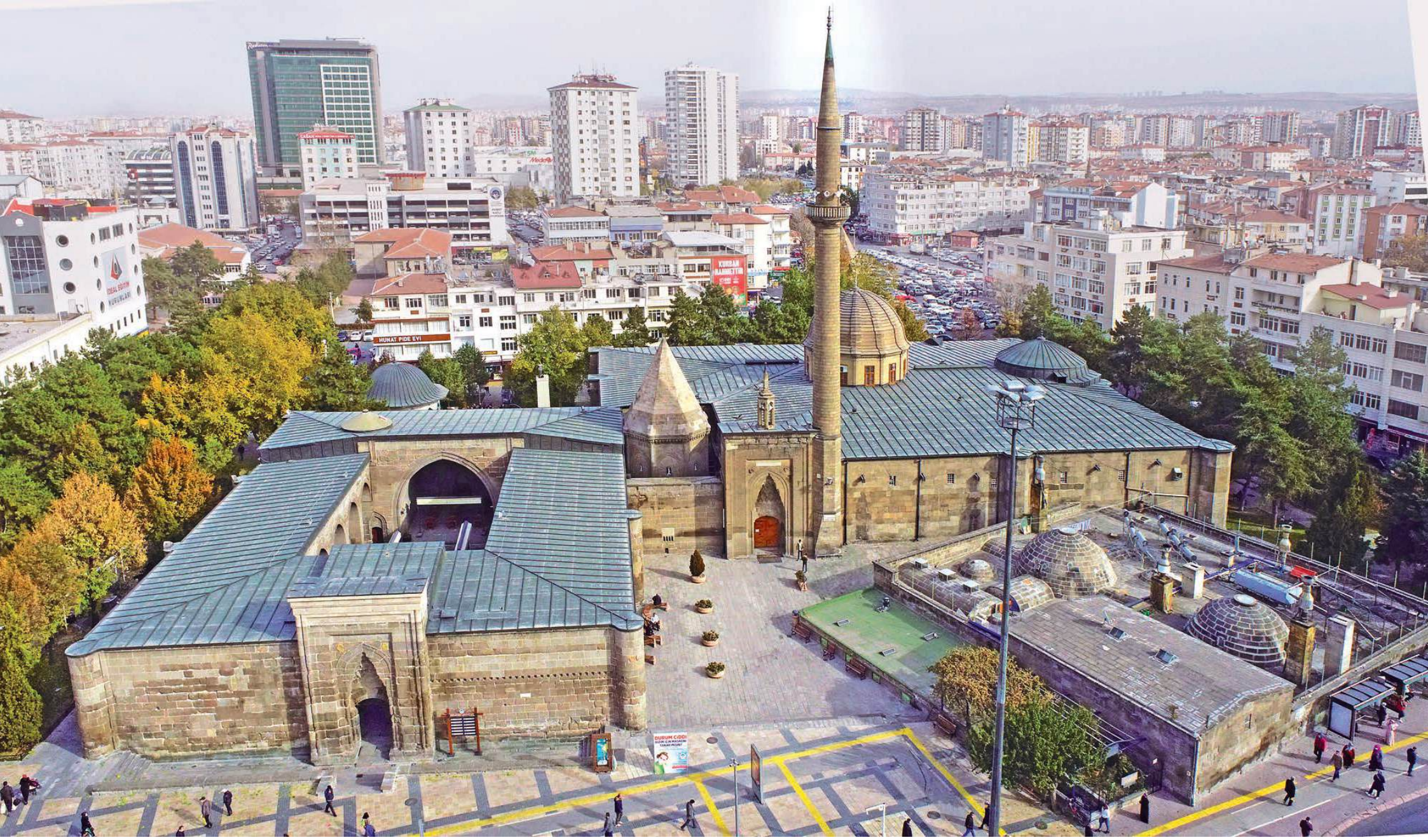
KAYSERİ HUAND HATUN KÜLLİYESİ 1236