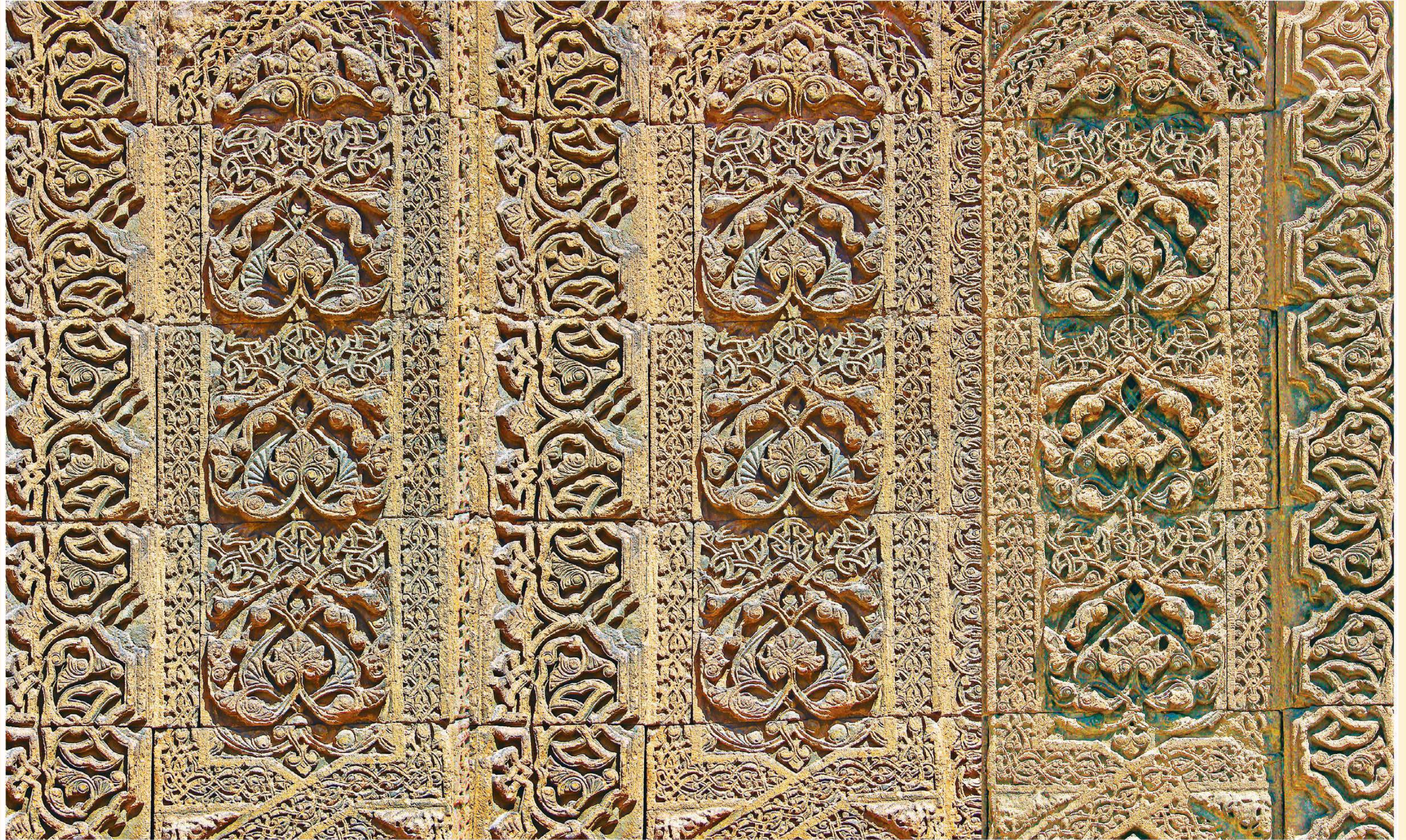
Amasya Dârüşşifası'nın orjinal Selçuklu taş kabartma süslemeleriyle bezeli taçkapısından detay (13.yy)

"Anadolu Selçuklu ve Osmanlı şifalı abideleri, ŞİFAHANELER" kitabından. Fotoğraf: Abdullah Kılıç