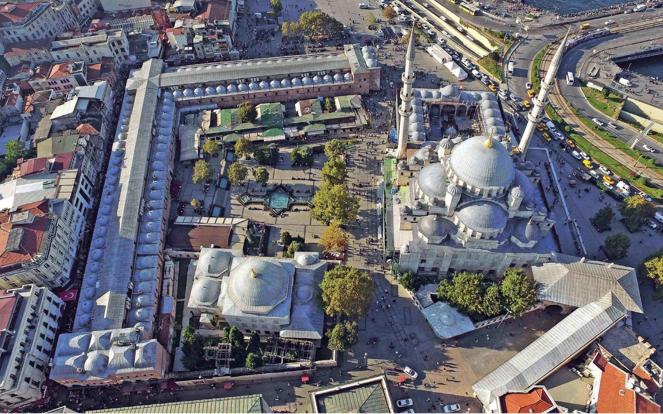
HATİCE TURHAN SULTAN'IN VAKFI YENİ CAMİ KÜLLİYESİ 1663