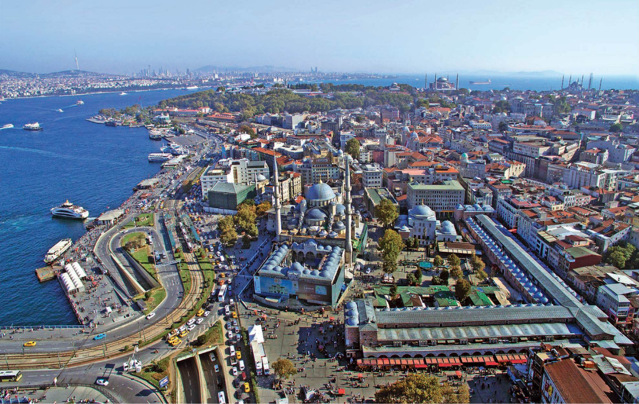
HATİCE TURHAN SULTAN'IN VAKFI YENİ CAMİ KÜLLİYESİ 1663