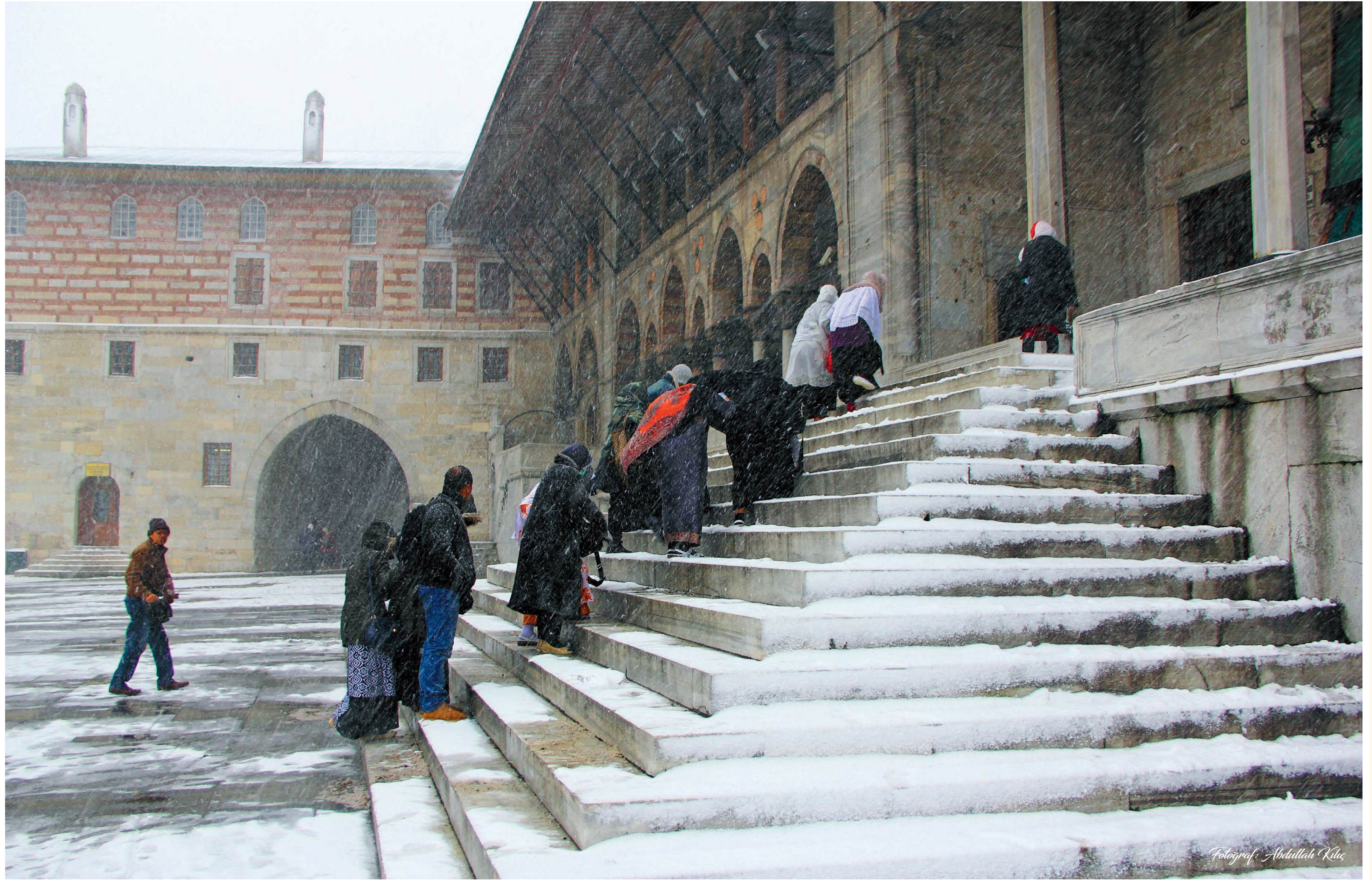
Karlı bir kış gününde caminin doğu kapısından giriş ve karşıda tamirattan yeni çıkmış Hünkâr Kasrı (8 Ocak 2013).