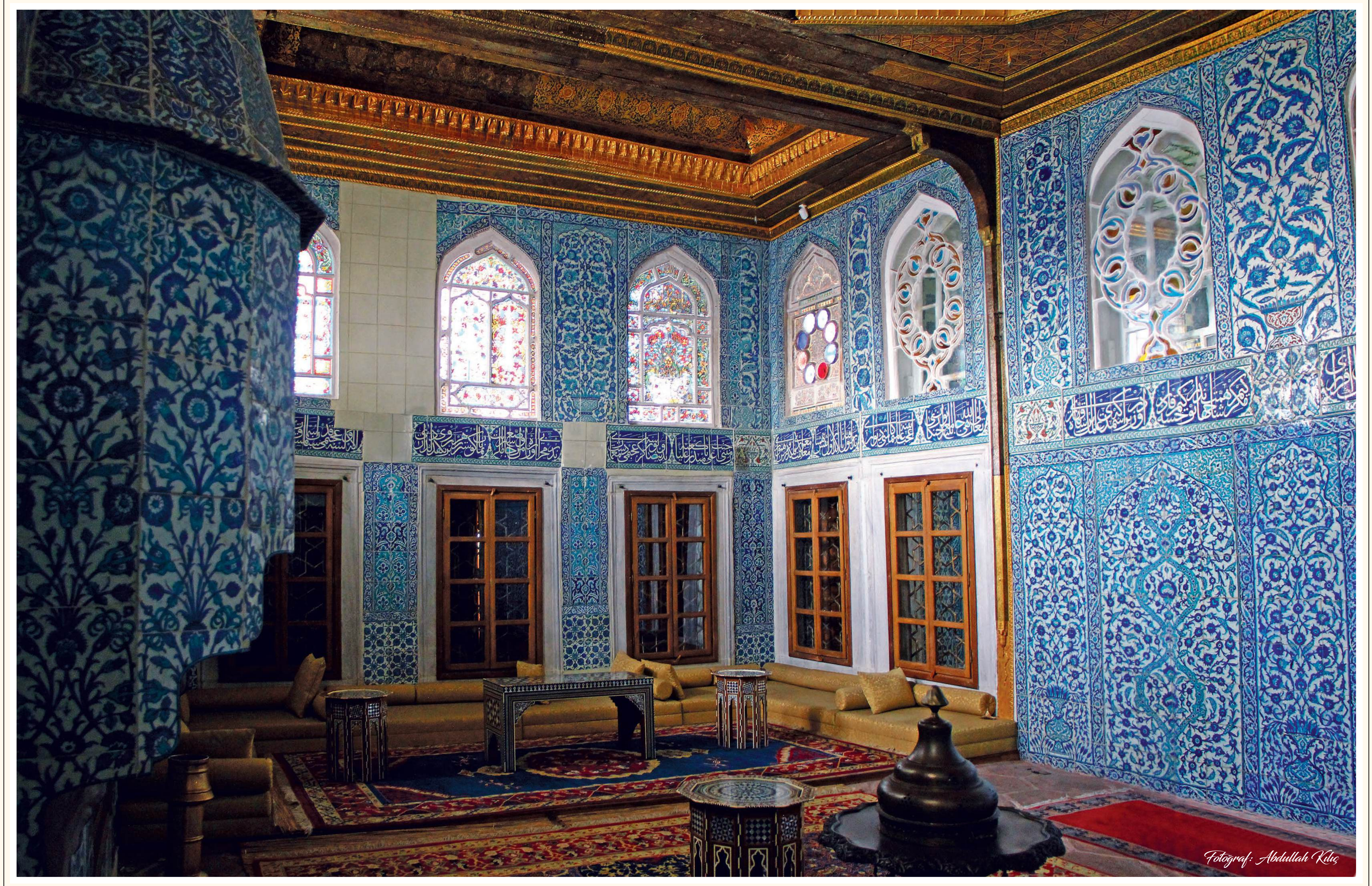
Hünkâr Kasrı'nda baş oda. Odanın duvarları tavana kadar çini ile tavan ise edirnekari ve kalem işleriyle süslenmiştir.