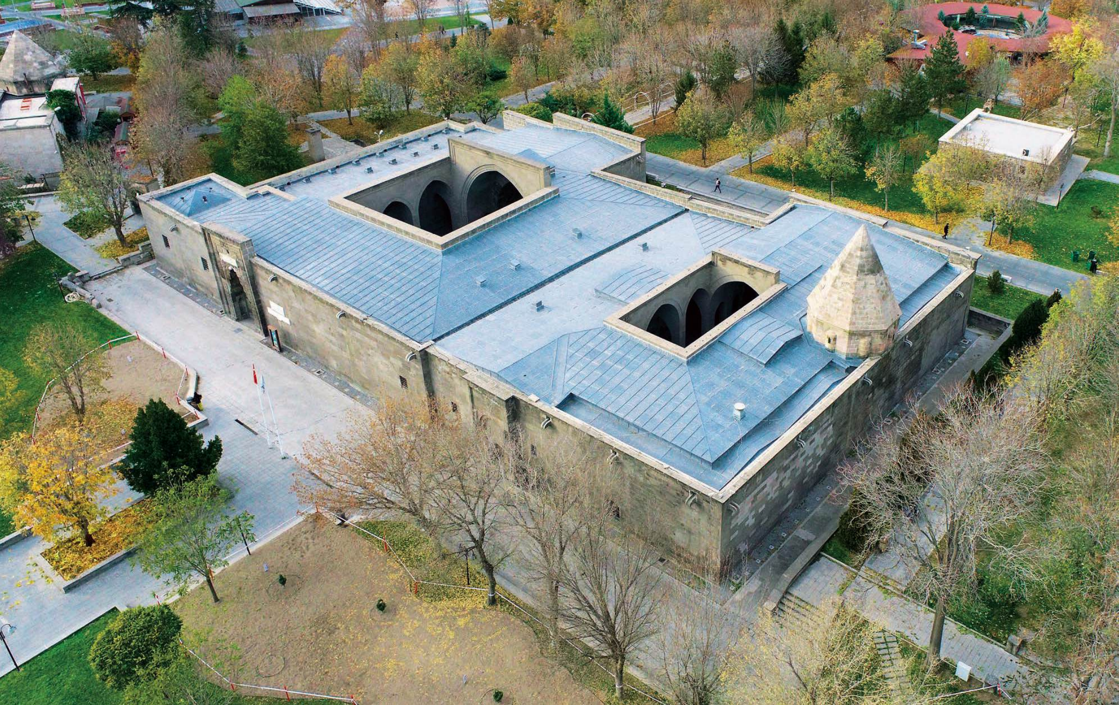
KAYSERİ GEVHER NESİBE ŞİFAHANESİ 1205